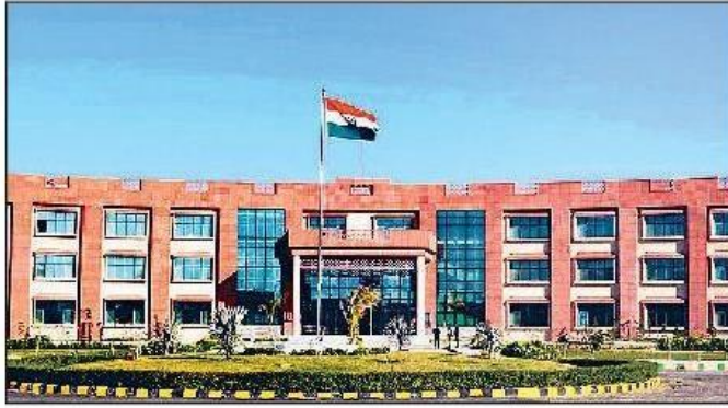
महेंद्रगढ़। हरियाणा केंद्रीय विश्वविद्यालय का भवन।