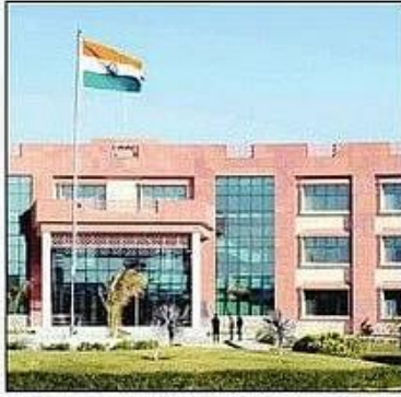
हरियाणा केंद्रीय विश्वविद्यालय। संवाद

41 कार्यक्रमों के अंतर्गत कुल 1482 सीटें